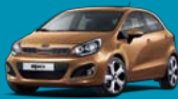
F2G_Caramel Yellow (málmlitur)