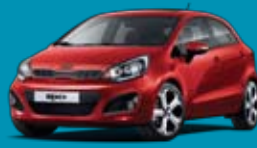
BEG_Signal Red (málmlitur)