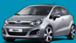
3D_Bright Silver (málmlitur)