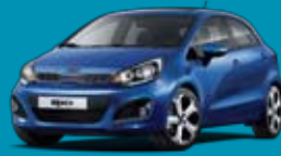
FBD_Electric Blue (málmlitur)