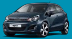
BLA_Deep Blue (málmlitur)