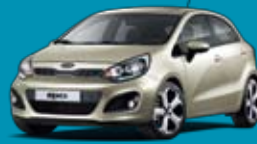
FDP_Fresh Beige (málmlitur)